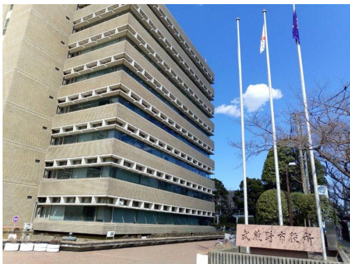
12月 武蔵野市内全小学校中学校 書籍寄贈