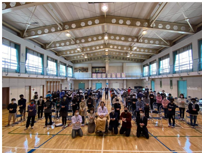
3月 東京都練馬区立北町西小学校 PFJ「命の授業」