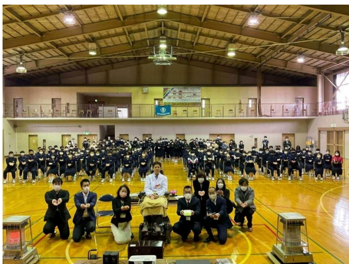
10月 宮城県仙台市立南光台東中学校 PFJ「命の授業」