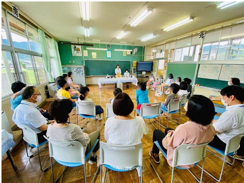
5月 埼玉県児玉郡神川町立神泉小学校 PFJ「命の授業」